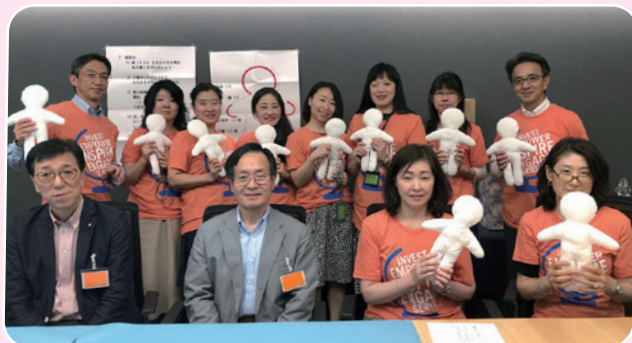
フランクリン・テンプレトン・インベストメンツ株式会社