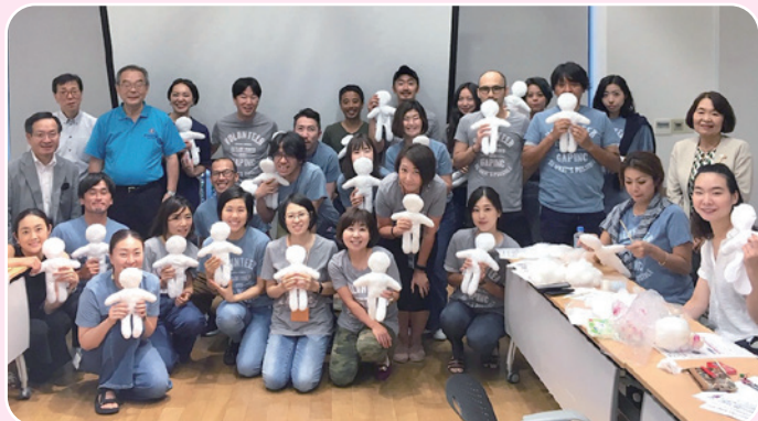
ギャップジャパン