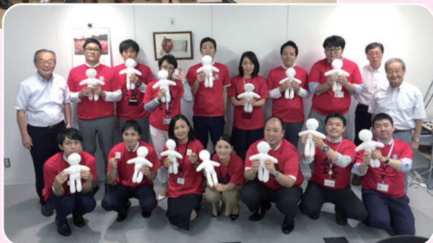
エドワーズライフサイエンス株式会社