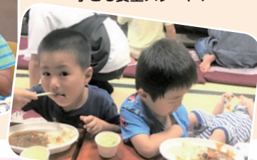
顔出しOKいただきました♪