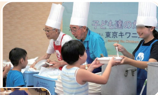
子ども食堂スタート!