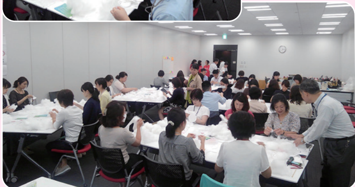
株式会社三菱UFJ銀行