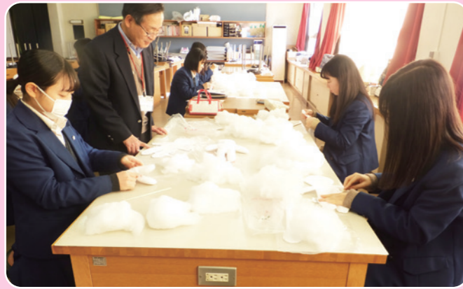
千葉県立検見川高等学校